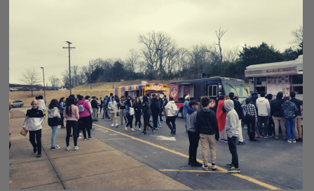
Students enjoy food trucks at Winter Bash