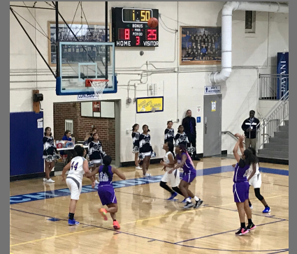
Our Marshall Girls' Basketball team in action against Antioch Middle