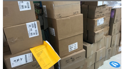
Student Novels, New Laptops, Agendas, and Marshall T-Shirts are ready for pick-up at the school starting 1/5/21