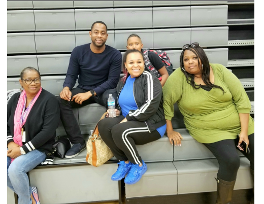
Marshall staff hang out at last year's basketball game to show their support for our team