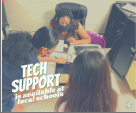
In-person tech support @ Glencliff High School at back of building off Holbrook drive by Tennis Courts