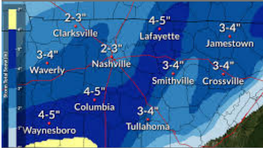
Weather.gov shows projected snow fall last week