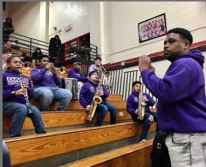
Pep Band fires up the team and the crowd

المساعدة الأكاديمية عبر الأنترنت & التدريب