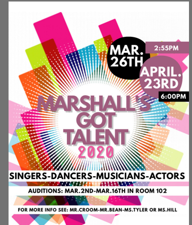
Get ready for Marshall's Got Talent!