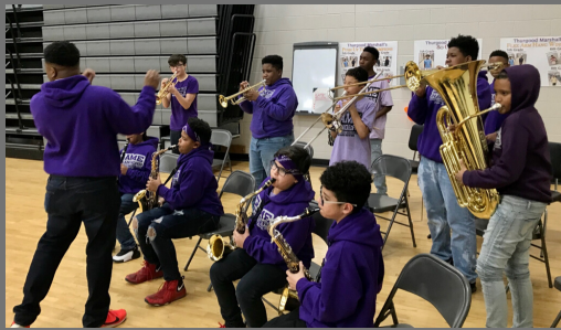
Mr. Weir & Pep Band inspire Girls' and Boys' teams to victory

المساعدات الأكاديمية عبر الأنترنت & التدريب