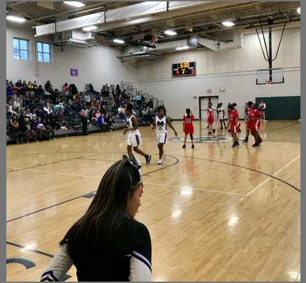
Our girls' team brings home another victory!