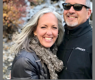
Ms. Love was nominated by students as the Teacher of the week