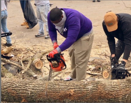
Mr. Dollar & other Marshall staff lend a helping hand

المساعدات الأكاديمية عبر الأنترنت & التدريب