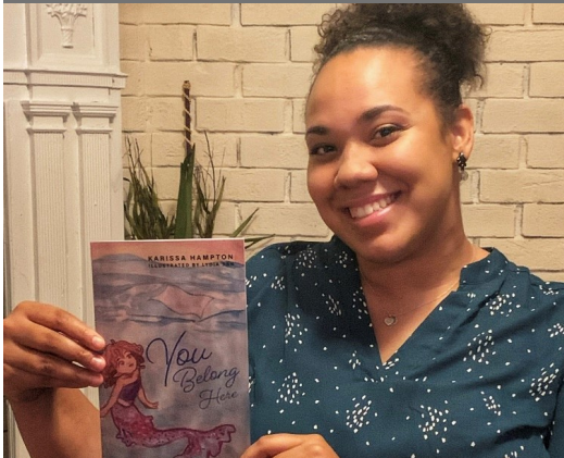
Ms. Hampton shares her new children's book