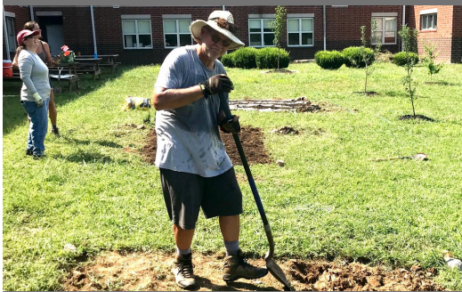
Our community partner Blessed Earth TN works with staff to kick off our community garden.