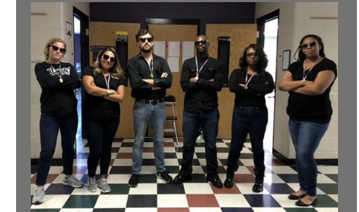
8th Grade Team looking cool in black!