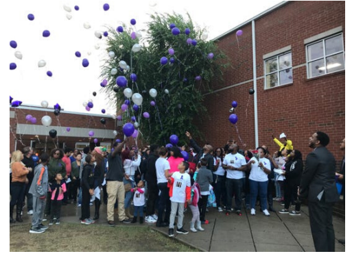
Balloon release at the end of the Celebration of Life

الأولية القصوى في مارشال هي توفير بيئة تعليمية آمنة لجميع الطلاب . في الآونة الأخيرة كان موظفوا الهجرة و الجمارك الأمريكية ICE نشطين في منطقة ناشفيل . نرغب مدرسة مارشال في التأكد من أن عائلاتنا تعرف أن المدارس ، محطات الأتوبيس ، و أماكن العبادة تصنف على أنها " مواقع حساسة " من قبل ICE . لا تستخدم هذه المواقع في أنشطة التنفيذ مثل عمليات القبض ، و المقابلات و عمليات التفتيش إلا في الظروف القصوى . يمكنك معرفة المزيد حول هذه السياسة بإتباع هذا الرابط link . نريد أيضاً أن تعرف عائلاتنا أن لهم رأينا في كيفية و توقيت مشاركة معلوماتهم الشخصية مع الوكالات الخارجية . وفقاً لقانون فدرالي يسمى FERPA ، لا يجوز مشاركة معلومات عائلتك خارج النظام المدرسي إلا بإذن منك ما عدا في ظروف معينة . تلتزم مارشال بكونها مكاناً آمناً لجميع الطلاب للتعلم و لكل أولياء الأمور لكي يشاركوا في تعليم أطفالهم .