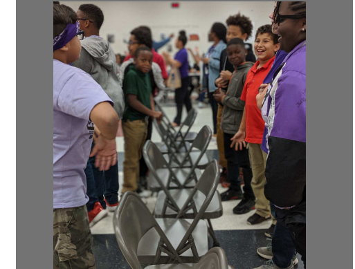
Students play musical chairs at lunch