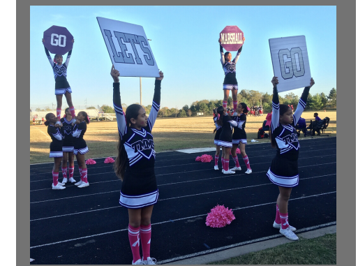
Cheerleaders take a stand for Breast Cancer