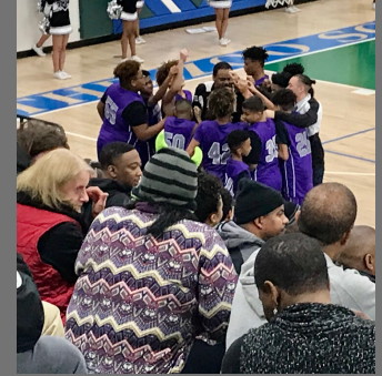
Boys huddle up to celebrate victory