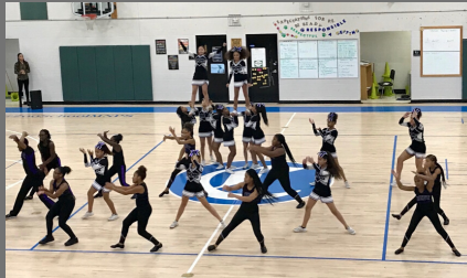
Royal Elite Dance Team (REDT) performs at halftime