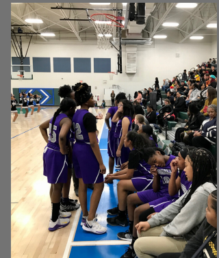
Our girls' team is still undefeated!