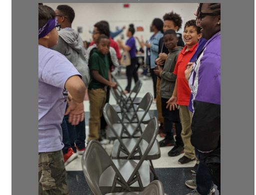
Students play musical chairs at lunch