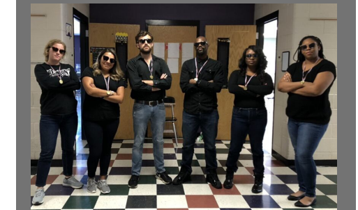
8th Grade Team looking cool in black!