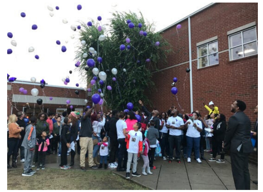
Balloon release at the end of the Celebration of Life

Puede obtener más información sobre esta política siguiendo este enlace. También queremos que nuestras familias sepan que pueden decidir cómo y cuándo se comparte su información personal con agencias externas. De acuerdo con una ley federal llamada FERPA, la información de su familia solo se puede compartir fuera del sistema escolar con su permiso, excepto en ciertas circunstancias específicas. Marshall se compromete a ser un lugar seguro para que todos los estudiantes aprendan y para que todos los padres participen en la educación de sus hijos.