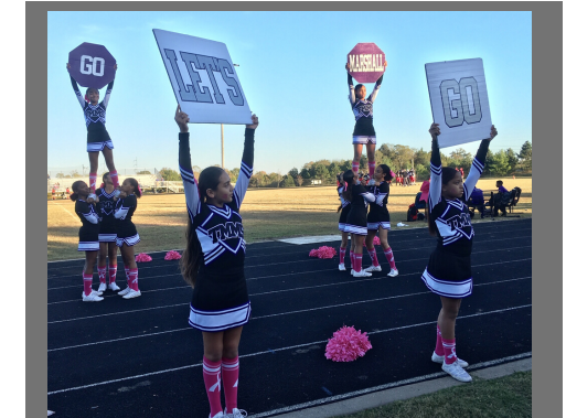
Cheerleaders take a stand for Breast Cancer