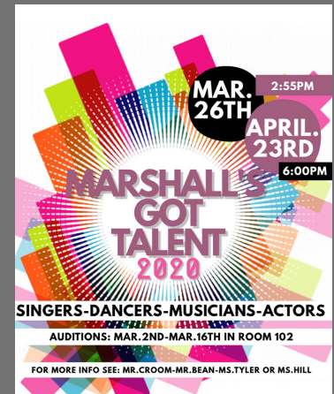
Get ready for Marshall's Got Talent!