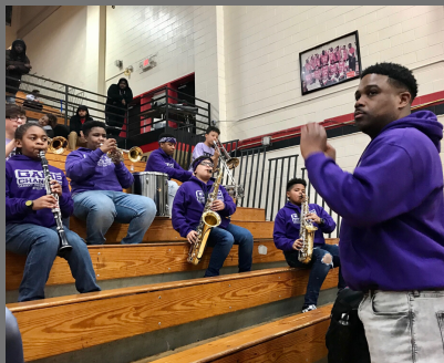
Pep Band fires up the team and the crowd