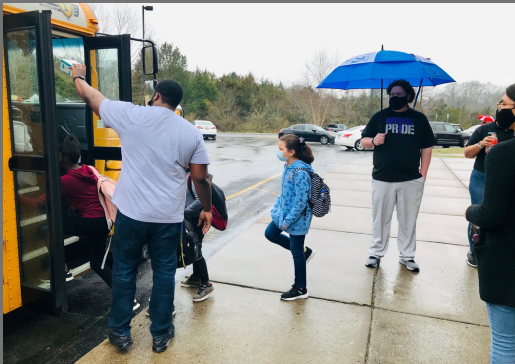
Staff support bus riders as they head home