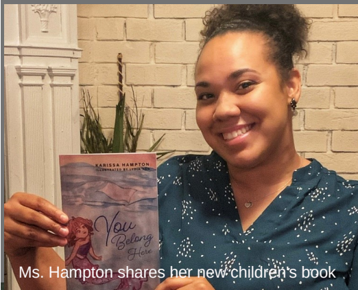
Ms. Hampton shares her new children's book