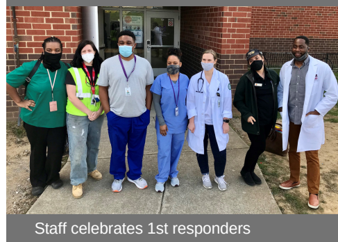
Staff celebrates 1st responders