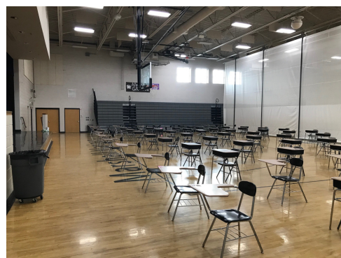
Marshall staff was ready for our Virtual students to join us at the school for testing